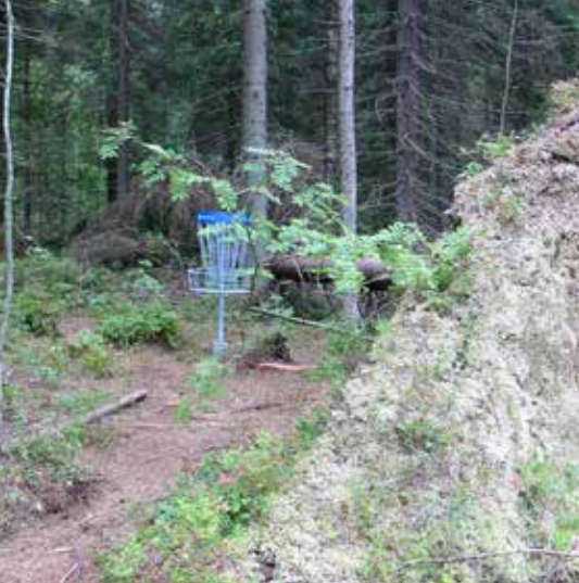
Frisbeekori metsän siimeksessä. Lisää frisbeestä sivulla 8.